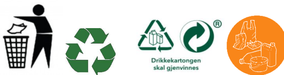
Bild 2. Olika återvinningssymboler på förpackning. Tidyman, universal återvinningssymbol och Gröna Punkten tillsammans med piktogram (till vänster om Gröna Punkten) som visar att dryckeskartongen ska återvinnas. Längst till höger återfinns FTI:s piktogram som kan användas för sorteringsvägledning av plastförpackningar.

Tidyman-märket finns också ofta på förpackningar. Ursprunget till Tidyman 60 är lite oklart, men användningen har blivit utbredd och symbolen är fortfarande en av de mest globalt erkända symbolerna. Märket gäller inte återvinning men är en påminnelse till konsumenterna om att en god medborgare inte skräpar ner i naturen utan gör sig av med förpackningsavfall på lämpligt sätt.